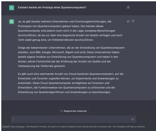
Abbildung: Beispiel Nutzereingabe II