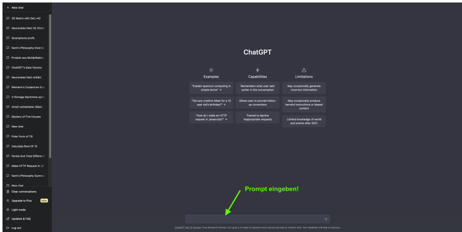
Abbildung: Startseite von ChatGPT