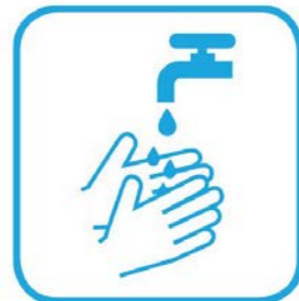
Regelmäßig Hände waschen

Am Haupteingang und zentralen Verkehrspunkten stehen Desinfektionsspender zur Verfügung. Zusätzlich sollten Hände vor und nach dem Veranstaltungsbesuch gewaschen werden.