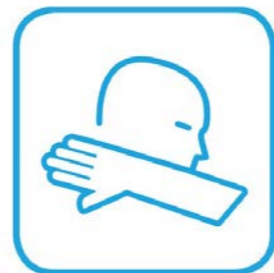
Richtig husten und niesen

Es gelten die einschlägigen Hygieneregeln und Richtlinien des Robert Koch-Instituts (Hygieneregeln sowie Nies- und Hustenetikette, Abstandsempfehlungen).