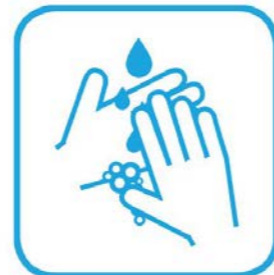
Hände gründlich waschen

Die ausgewiesenen Verkehrsflussregelungen sind zu beachten. Für die Nutzung der Aufzüge gelten separate Verhaltensrichtlinien. Schwerbehinderten Kommilitoninn*en ist Vorrang für die Aufzugnutzung zu gewähren. Empfohlen wird die Nutzung der Treppenhäuser unter Berücksichtigung der Mund-Nase-Bedeckung.