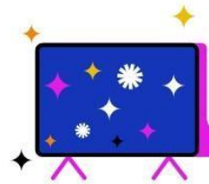
Kostenfreier Zugang zu RTL+