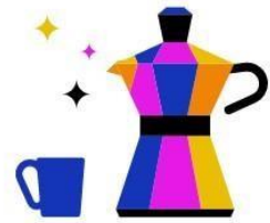
Kantine & Café- Bar