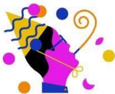
RTL Events & Partys