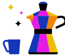
Kantine & Café- Bar