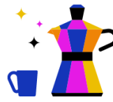
Kantine & Café- Bar