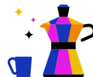
Kantine & Café- Bar