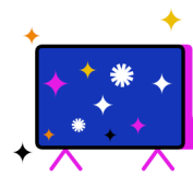
Kostenfreier Zugang zu RTL+