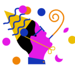
RTL Events & Partys