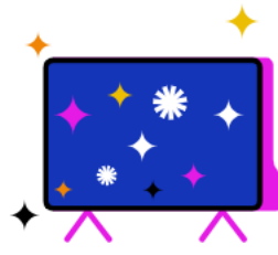
Kostenfreier Zugang zu RTL+