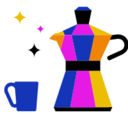
Kantine & Café- Bar