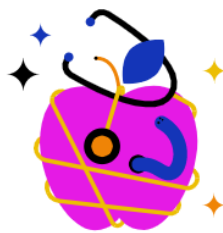
Gesundheit & Fitness