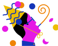
RTL Events & Partys