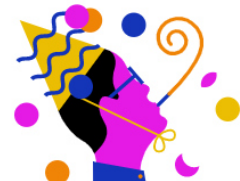
RTL Events & Partys