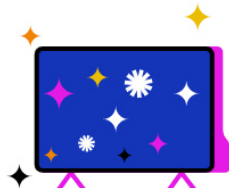
Kostenfreier Zugang zu RTL+