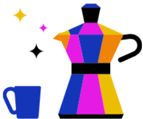
Kantine & Café- Bar