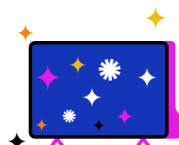
Kostenfreier Zugang zu RTL+