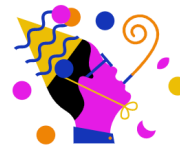
RTL Events & Partys